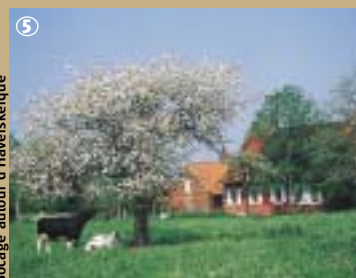
Bocage autour d'Haverskerque

Alors, si tout ce petit monde ne vous fait pas peur, explorez-en toutes les branches mais sans laisser un arbre vous cacher la forêt !