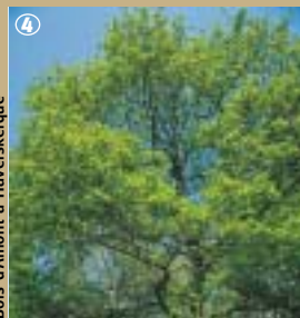
Bois d'Amont à Haverskerque

Si vous aimez les sensations fortes, osez la promenade au cœur de la Forêt domaniale de Nieppe.