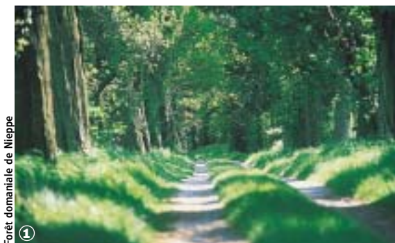
Forêt domaniale de Nieppe