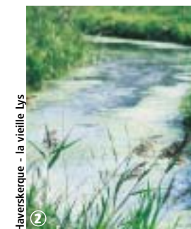
Haverskerque - la vieille Lys