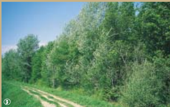
Bois d'Amont à Haverskerque